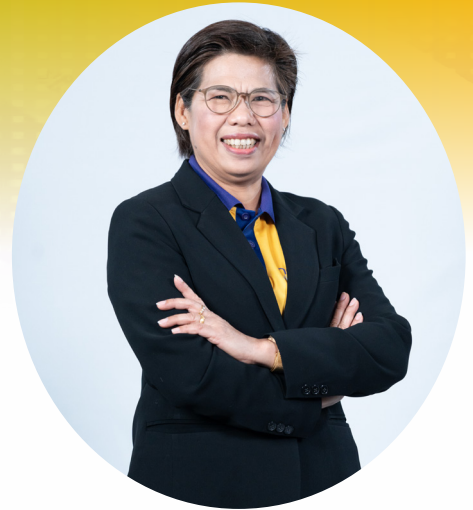
นางอรรณญา เนตรพยอม รองปลัดเทศบาลนครพิษณุโลก ปฏิบัติหน้าที่นายกเทศมนตรีนครพิษณุโลก