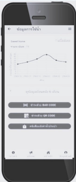
Application SMART PRAPA

#กัมพูชายังก่อน #ไทยนี้รักสงบแต่ถึงรบไม่ขลาด