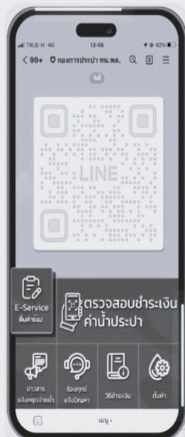
LINE กองการประปา @pmwa