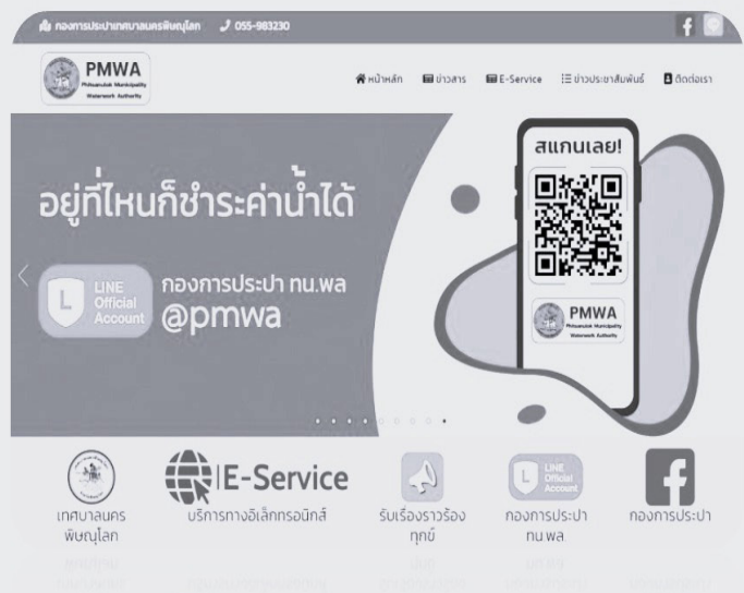
Website กองการประปา https://prapa.phsmun.go.th